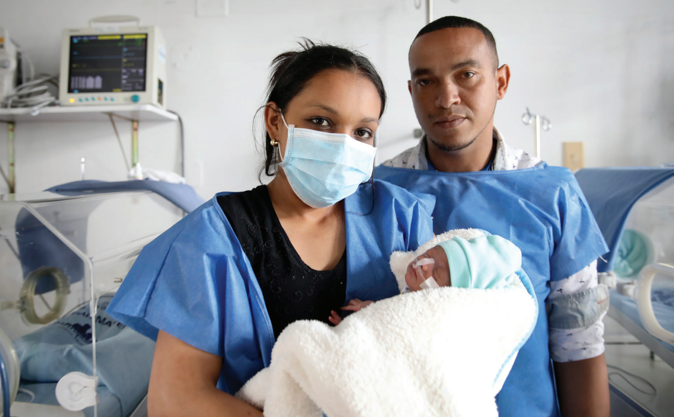
Proyecto Primero la Niñez, Colombia.