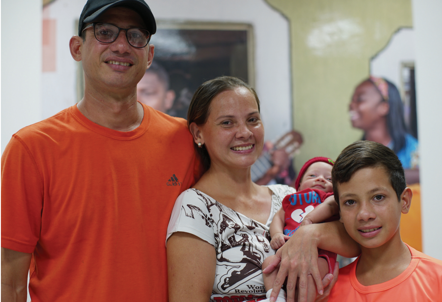
Proyecto Primero la Niñez Colombia.