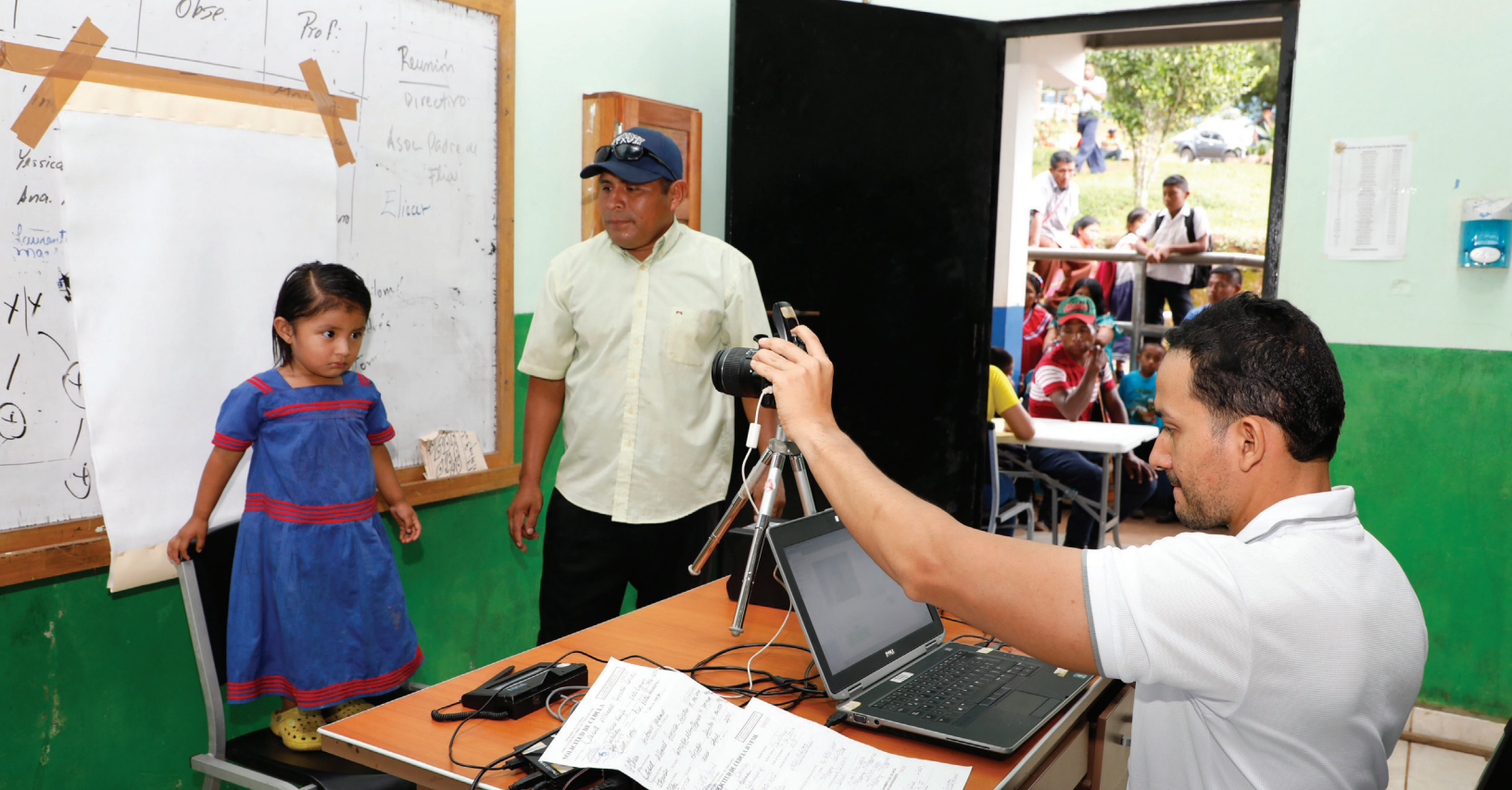
Misión de terreno al Tapón del Darién