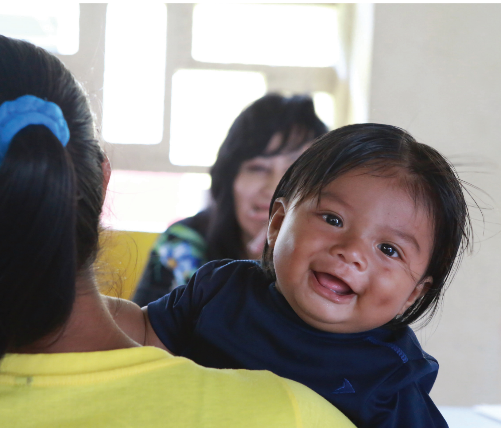
Misión de terreno al Tapón del Darién

que pruebe la nacionalidad de los padres constituye uno de los principales obstáculos para registrar los nacimientos ocurridos en países de acogida de sus hijos e hijas, así como para registrar el nacimiento de estos ante los consulados de su país para que adquieran o confirmen su nacionalidad por consanguinidad. La ausencia del documento de identidad que prueba la nacionalidad impide que los niños y niñas accedan a sus derechos básicos, lo cual los expone a mayores riesgos de protección, particularmente en contextos de movilidad humana.