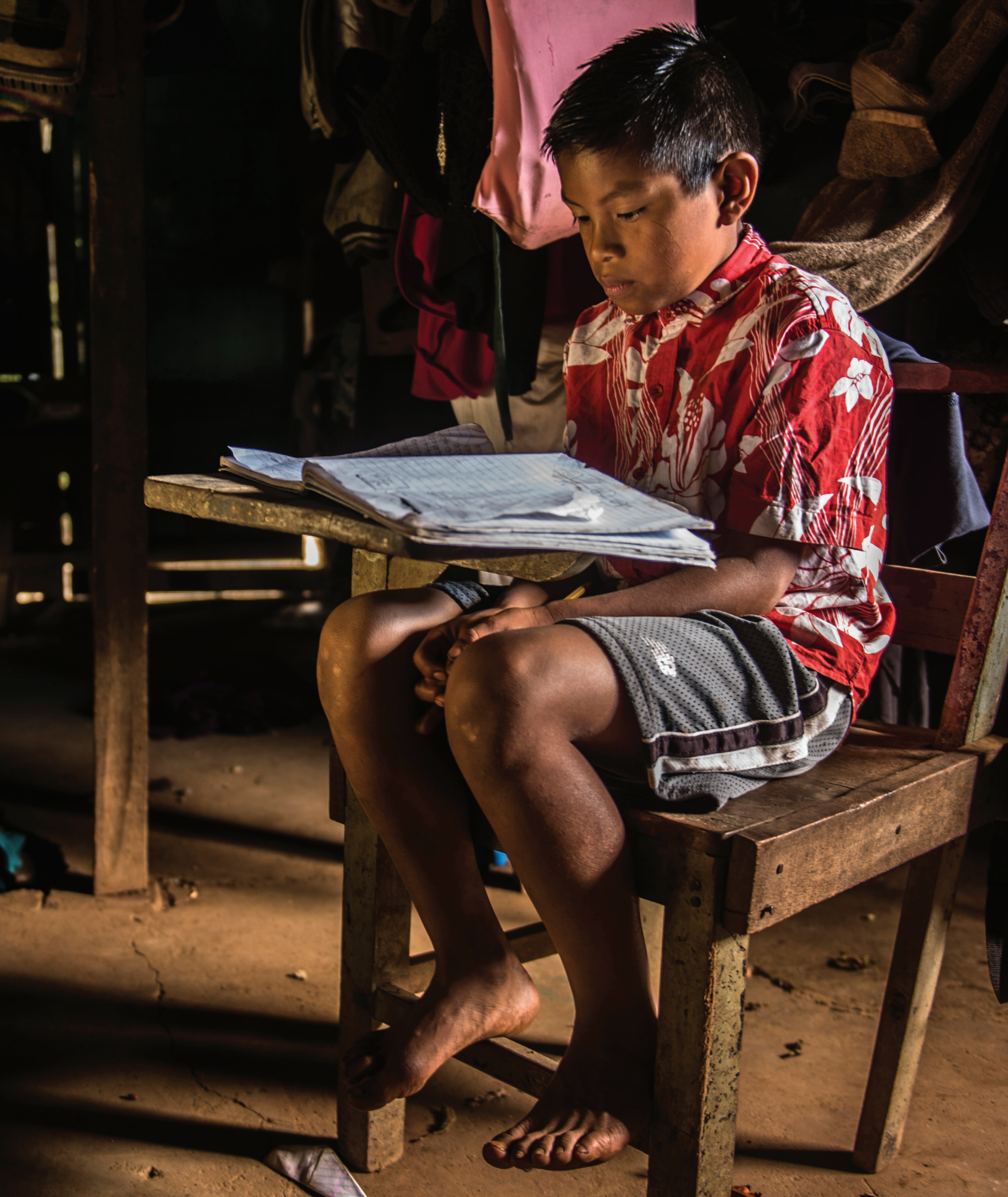
Proyecto Chiríticos. San Vito de Coto Brus, Costa Rica.