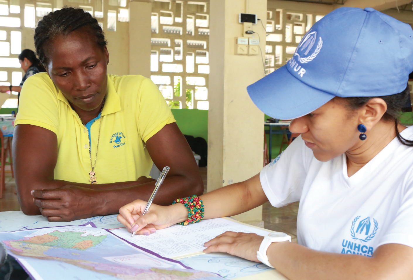
Misión de terreno al Tapón del Darién