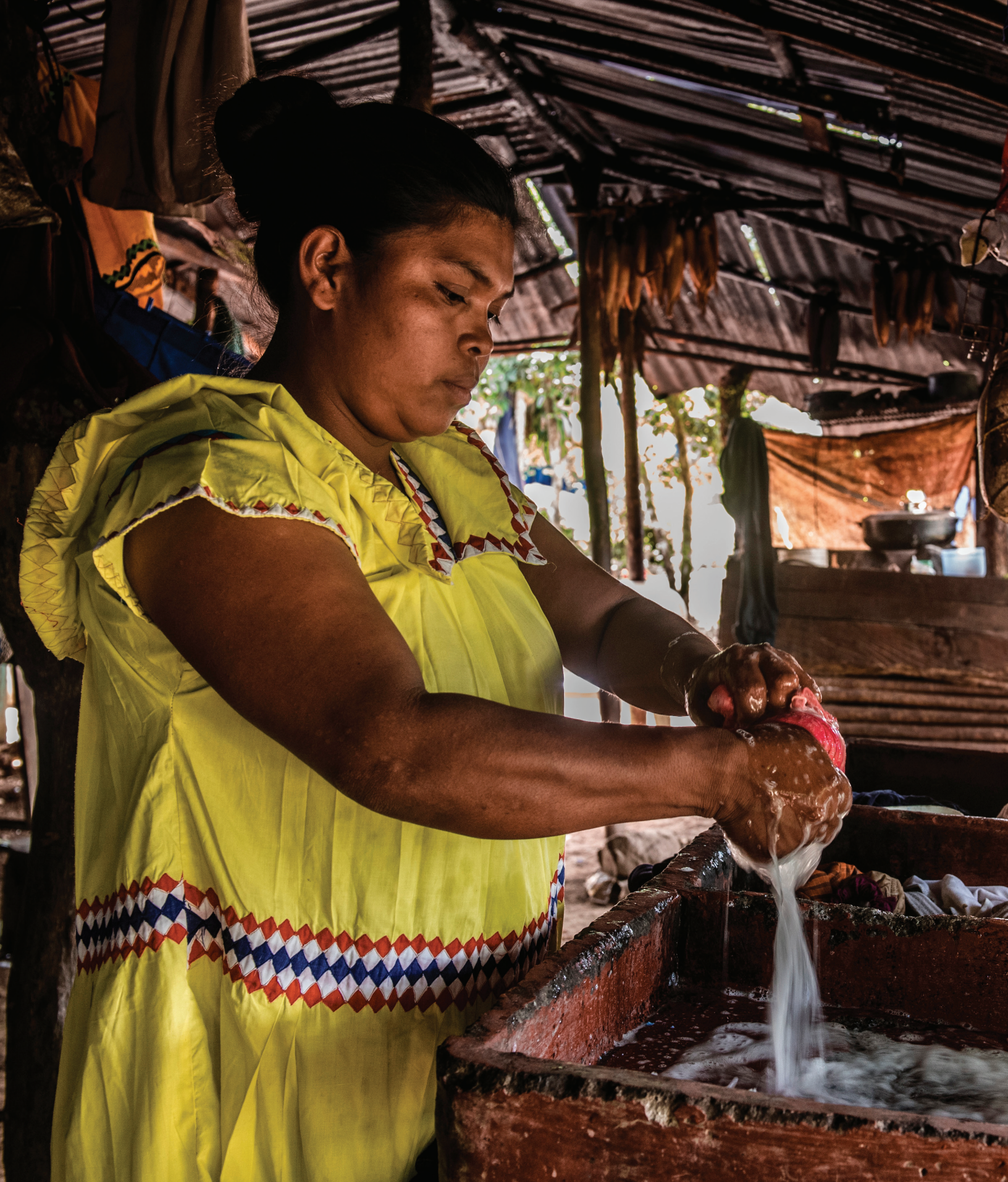
Proyecto Chiríticos. San Vito de Coto Brus, Costa Rica.