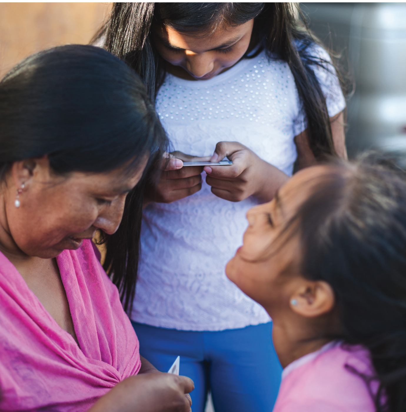
Proyecto #Chilereconoce. Iquique, Chile.

El registro tardío hace referencia a la inscripción de un hecho vital posterior a lo establecido en las leyes o regulaciones existentes de cada Estado. Ya que el registro tardío procede después del “periodo de gracia” establecido por cada Estado, aumentan los requisitos probatorios del hecho de nacimiento. En algunos países el procedimiento para el registro tardío de nacimientos se puede resolver administrativamente, mientras que en otros solo se pueden tramitar vía judicial o una combinación de ambos.