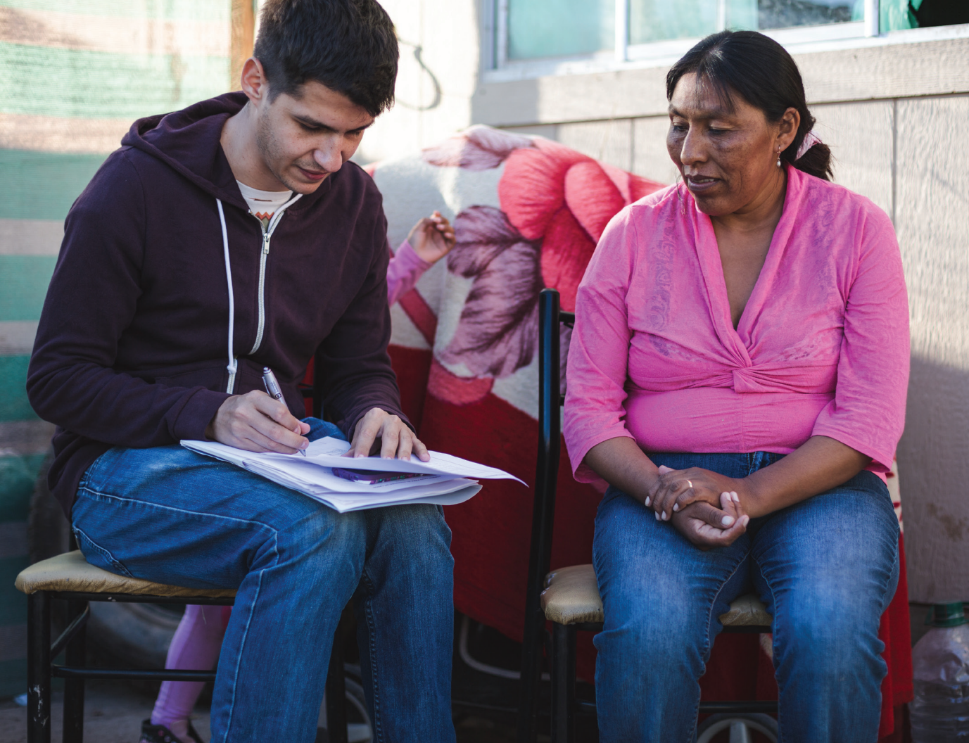
Proyecto #Chilereconoce. Iquique, Chile.