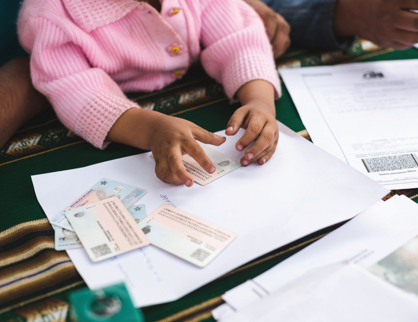
Proyecto #Chilereconoce. Iquique, Chile.