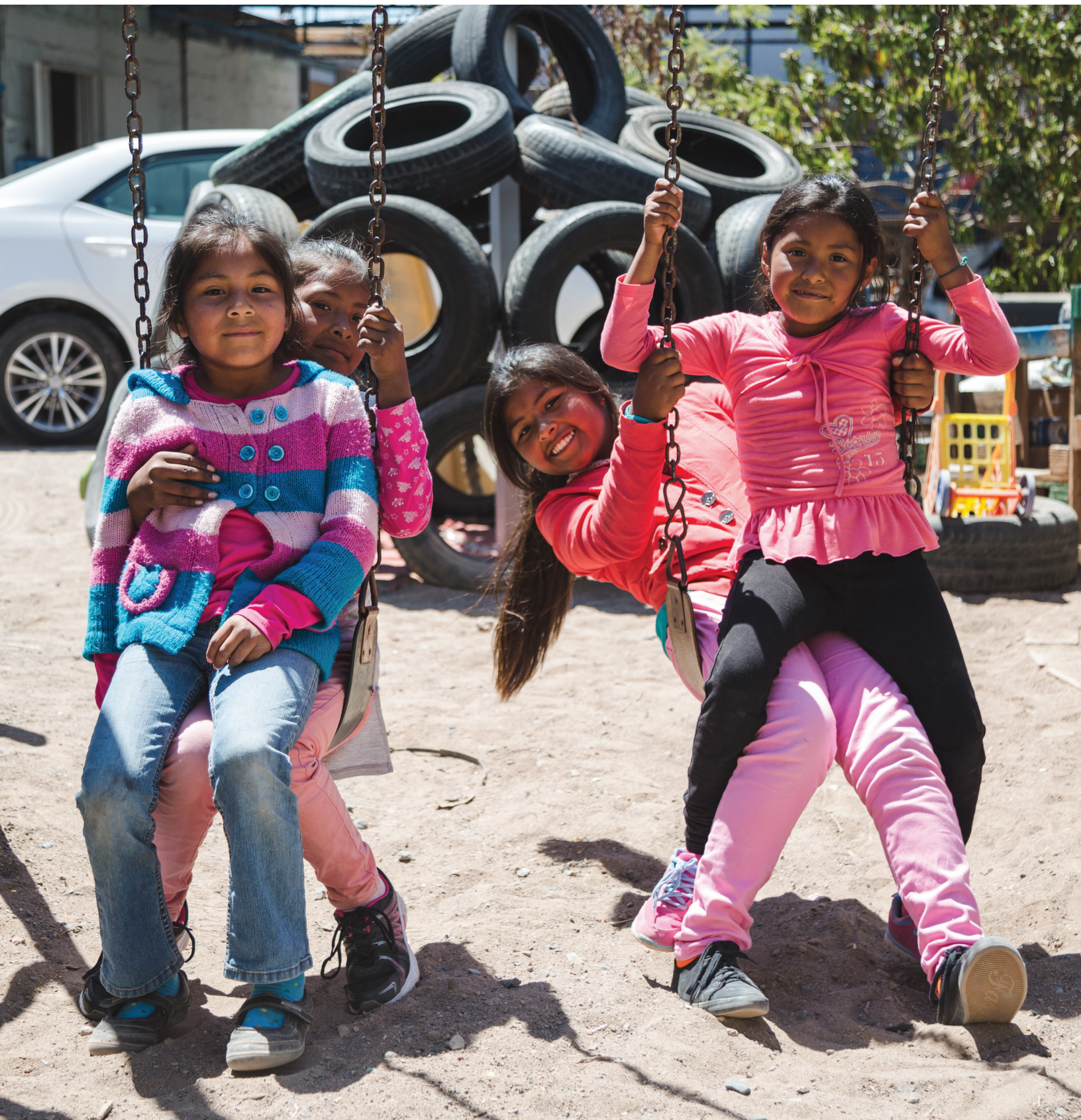
Proyecto #Chilereconoce. Iquique, Chile.