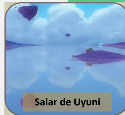
Salar de Uyuni