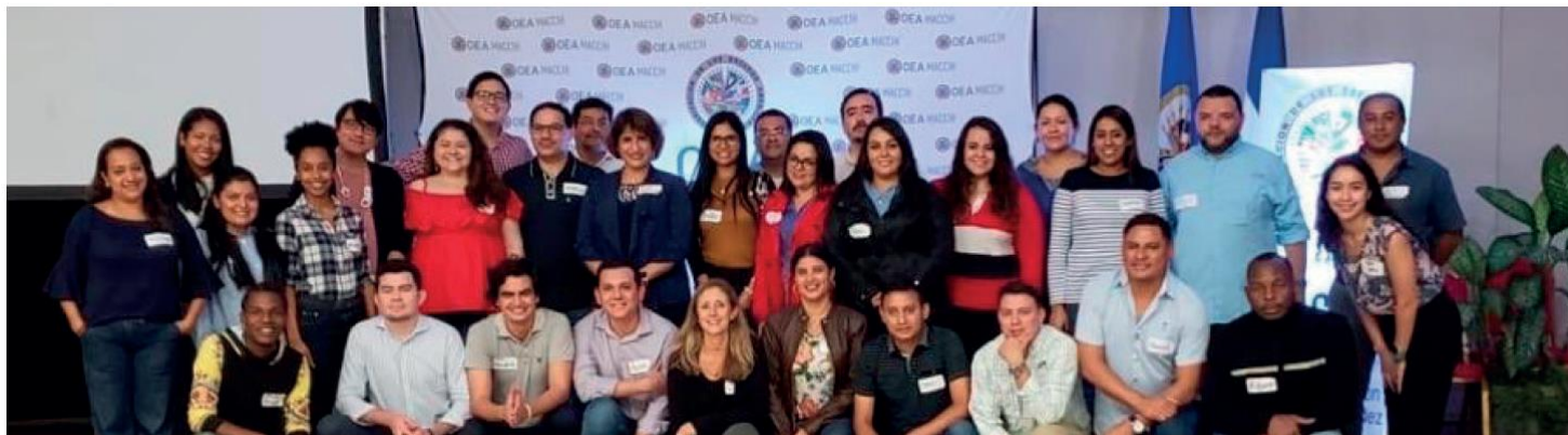
Participantes del Fellowship en Honduras (2019).