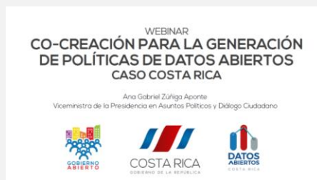
Presentación Costa Rica