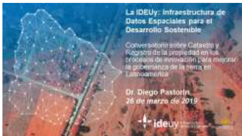
Sesión LATAM: Uruguay