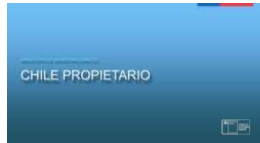
Sesión LATAM: Chile