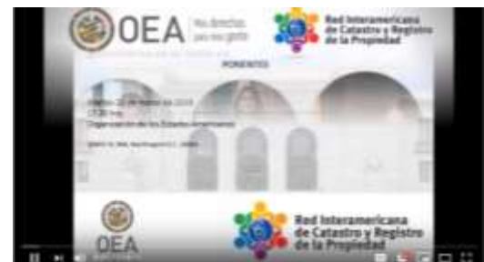
Video de la Sesión