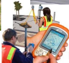
LiDAR & GPS