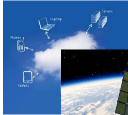
Use of the Cloud