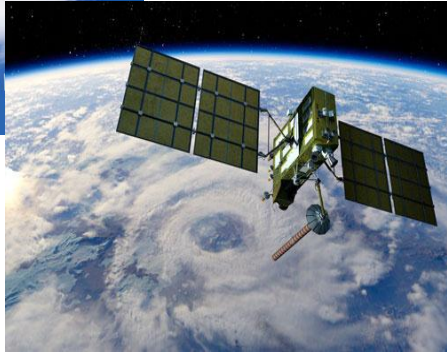
Aerial and satellite imagery