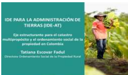
Sesión LATAM: Colombia