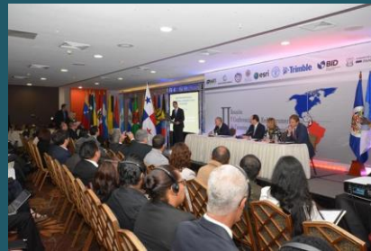
Mesa principal en inauguración