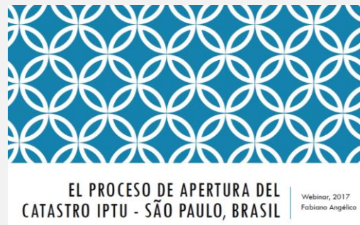
Presentación Sao Paulo, Brasil