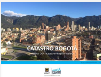
Presentación Bogotá, Colombia