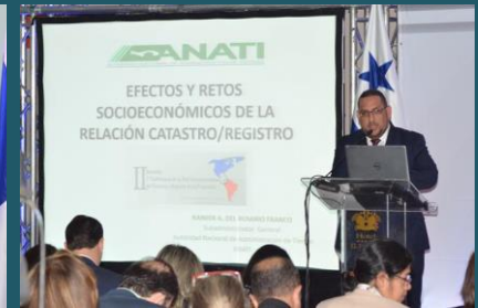
Presentaciones de país (Panamá)