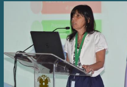
Presentaciones de país (Uruguay)