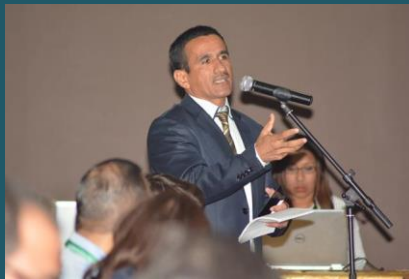
Sesión de preguntas y respuestas