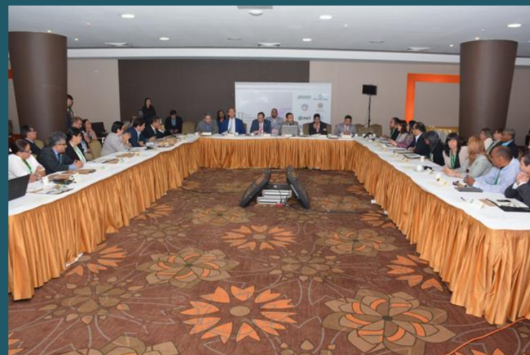
II Sesión de Asamblea de la Red Interamericana de Catastro y Registro de la Propiedad, 2016, en Panamá