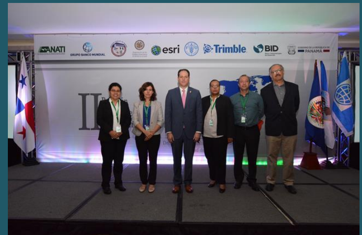
Autoridades 2017 de izquierda a derecha: El Salvador, México, Panamá, Jamaica, Brasil, Ecuador.