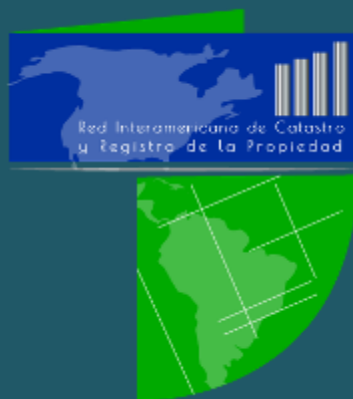
Propuesta República Dominicana

Con el objetivo de generar un sentido de pertenencia hacia la Red, la Secretaría Técnica de la Red lanzó un concurso para generar el logo de la Red. Este concurso fue lanzado en Junio de 2016 y cerró su periodo de postulaciones el 30 de Agosto. 4 países presentaron sus postulaciones: Colombia, Guatemala, República Dominicana y Uruguay; habiendo resultado ganador Uruguay con Colombia en segundo lugar. Propuestas: